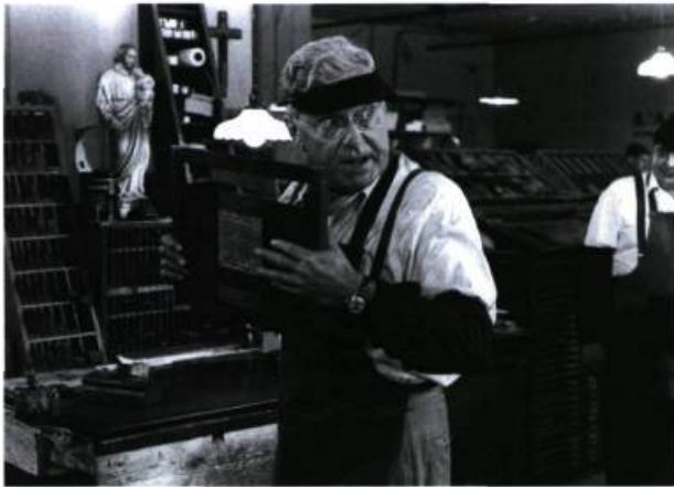
Émile Genest dans Les Plouffe (1981).