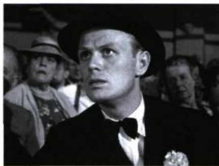
Night and the City de Jules Dassin (1951).

ment cette pensée de Pascal : l'important n'est pas tant de savoir si telle entité existe ou non, mais de s'interroger sur les avantages que l'on a à croire que cette entité existe ou non. Quant à l'enjeu romanesque du film, il éclate le temps d'une grande scène lyri-