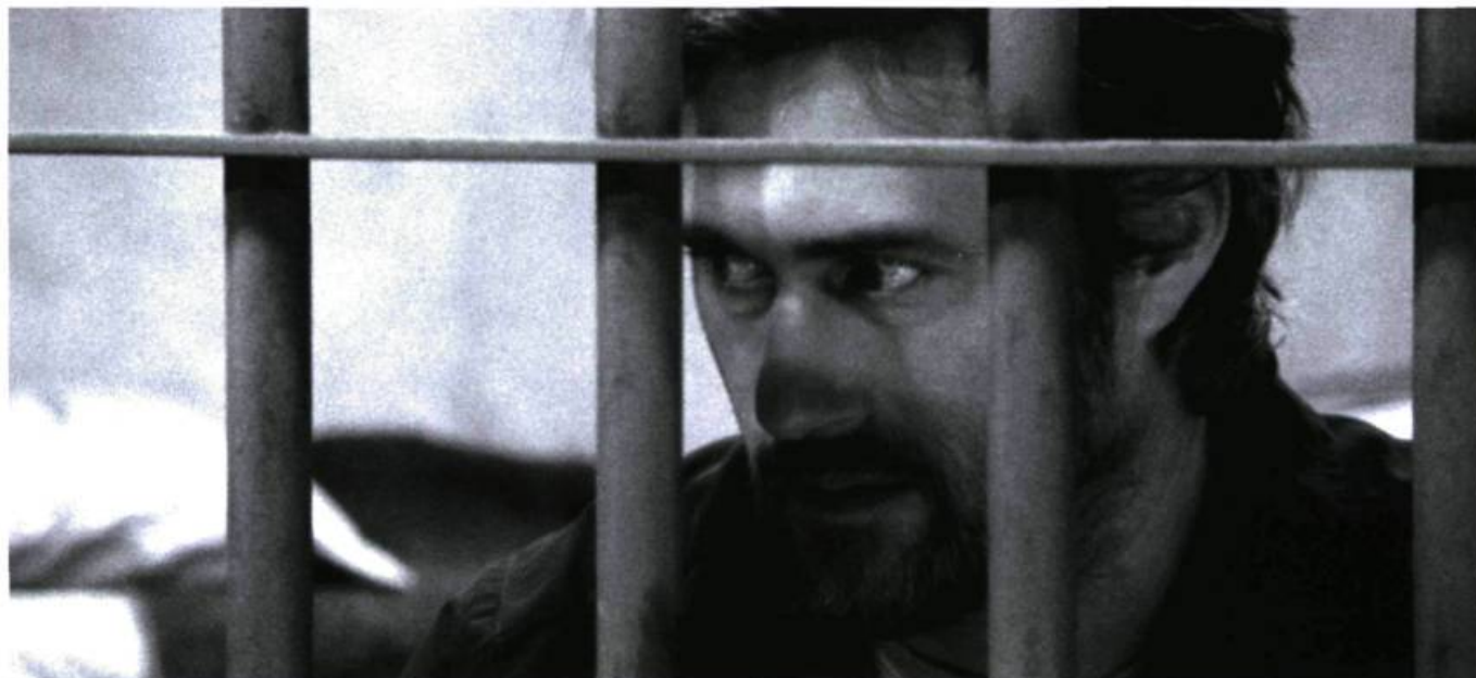
Huit « façons de mourir » : à quel moment la peine de mort apparaît-elle plus raisonnable ?