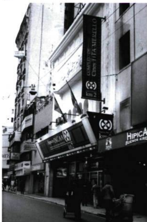
Espacio Tita-Merello/Km/2, le premier cinéma repris par l'INCAA, dans le quartier des cinémas en plein centre de Buenos Aires.

Grand centre de production cinématographique pendant les années 1930-1950, l'Argentine a une culture et une tradition cinématographiques. On y produisait des films sur une base industrielle, bien avant le Québec et le Canada. Toutefois, il faut noter que, contrairement à chez nous, l'INCAA 1 , même s'il revendiquait récemment son autonomie, ne s'est pas transformé en «partenaire» capitaliste de la production : il est plutôt devenu un protecteur officiel de la culture et du patrimoine national qu'est la création cinématographique.