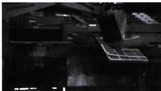
Façade du cinéma York en ruine et en démolition.