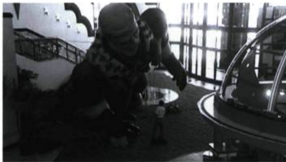
Superhéros gonflable, symbole de la « machine à tuer » du cinéma populaire américain. Les photos des pages 11 à 20 sont tirées du film À l'ombre d'Hollywood de Sylvie Groulx.

Vision réductrice et alarmiste que tout cela ? Sans doute. L'humanité n'en est pas après tout à sa première mondialisation. L'art