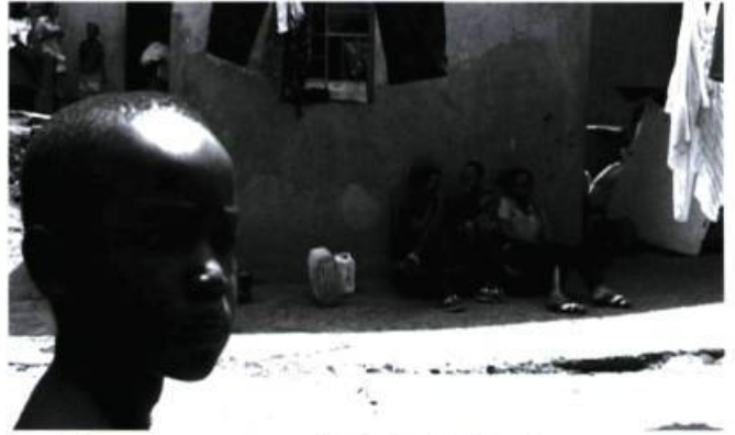
Après (un voyage au Rwanda) de Denis Gheerbrant. Mettre en relief notre humanité commune.

On retrouve un respect et une humilité semblables dans le très beau Que sera? 1 de Dieter Fahrner, qui a travaillé durant plusieurs mois dans une résidence pour person-