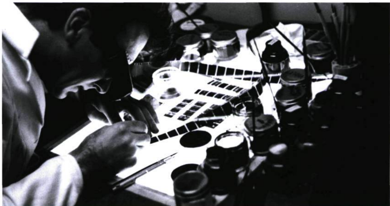
McLaren grave Blinkity Blank (1955).