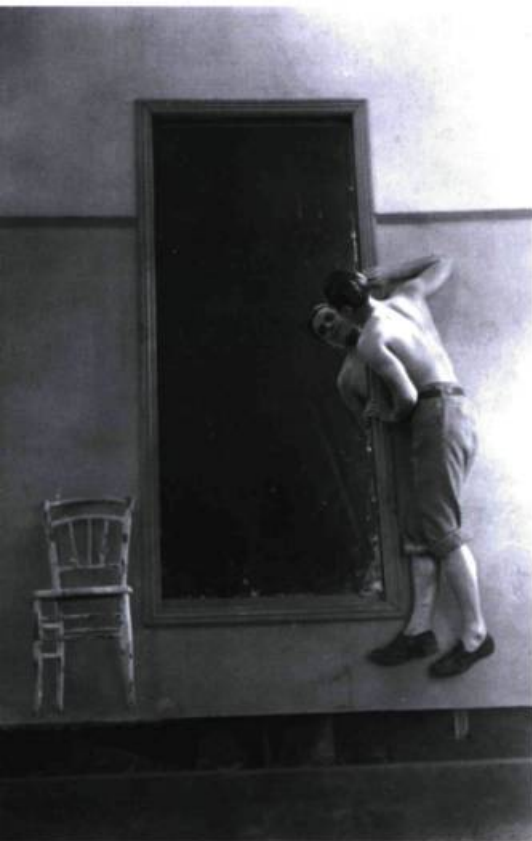
Le sang d'un poète (1930).

Premier film de Cocteau, Le sang d'un poète demeure un objet inclassable, rempli d'illuminations autant que de maladroites. Notons au passage qu'on y reconnaît la splendide Lee Miller, qui fut un temps la compagne et le modèle de Man Ray. Dans ce court métrage (55 minutes), Cocteau établit l'ensemble des paramètres de son œuvre cinématographique : le cinéma est pour lui un véhicule poétique, un moyen puissant – par le recours au merveilleux et le réalisme de l'image photographique – de faire vivre au spectateur une expérience poétique proche du rêve. Sur le plan thématique, le film est