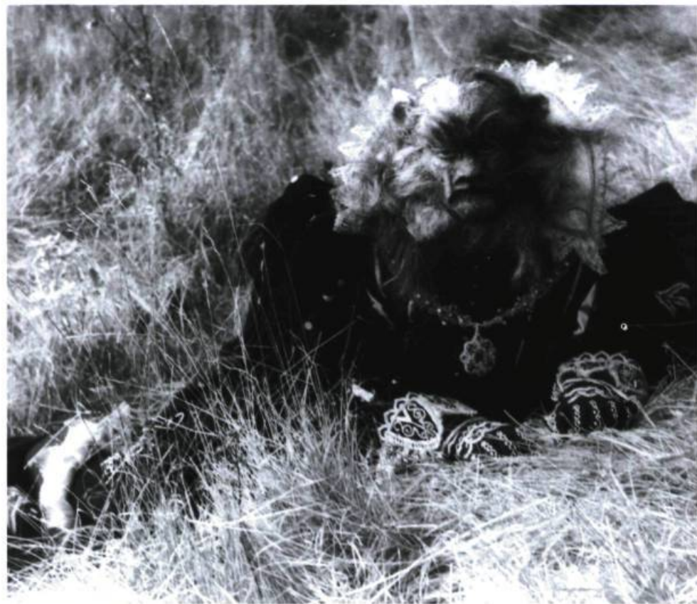
La belle et la bête (1946). Cocteau ou le cinéma comme expérience poétique proche du rêve.

Étant édités aux États-Unis, les DVD consacrés à Cocteau sont commercialisés sous leurs titres anglais. Les sous-titres anglais y sont optionnels.