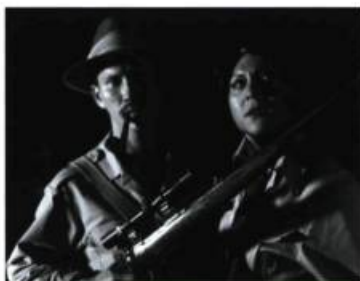
The Adventures of Iron Pussy.

Weerasethakul, qui a étudié à l'Institut des beaux-arts de Chicago, est le fer de lance d'un renouveau du cinéma d'auteur thaïlandais, cela depuis son premier film, Mysterious Object at Noon (1999). Nous aurions dû voir débarquer cette cinématographie sur la scène internationale en 2001, année du film Fah Talai Jone (Tears of the Black Tiger) , pastiche du cinéma de genre (entre le western, le mélodrame et la comédie) étonnamment coloré (entendre ici jaune, rose, vert et pourpre) réalisé par Wisit Sasanatieng. Mais c'était sans compter la compagnie de distribution nord-américaine Miramax qui en a acheté les droits et qui le garde, depuis, sur ses étagères, ne sachant qu'en faire. Un autre cinéaste thaïlandais à avoir dernièrement fait sensation hors de son pays est Pen-ek Ratanaruang. Son Mon-rok Transistor (2001) combinait savamment une approche très commerciale en matière de narration et un style visuel étonnant, tout en expérimentations. Si Ratanaruang a commencé sa carrière comme cinéaste commercial par le très populaire en Thaïlande Fun