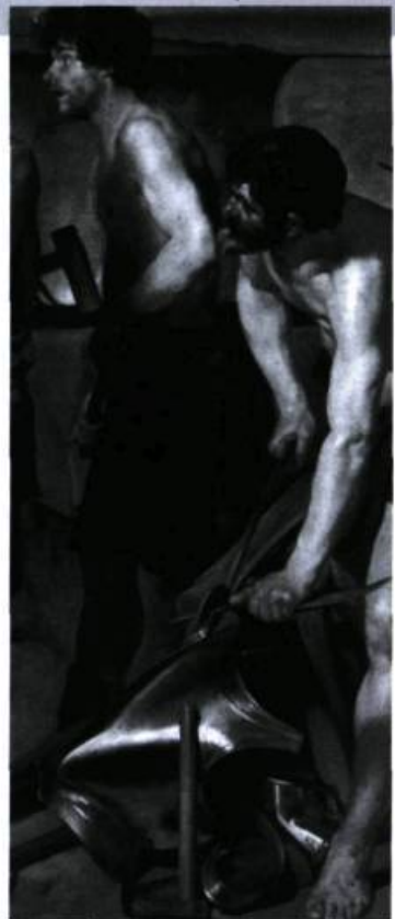
Les forges de Vulcain, Vélasquez, 1630.