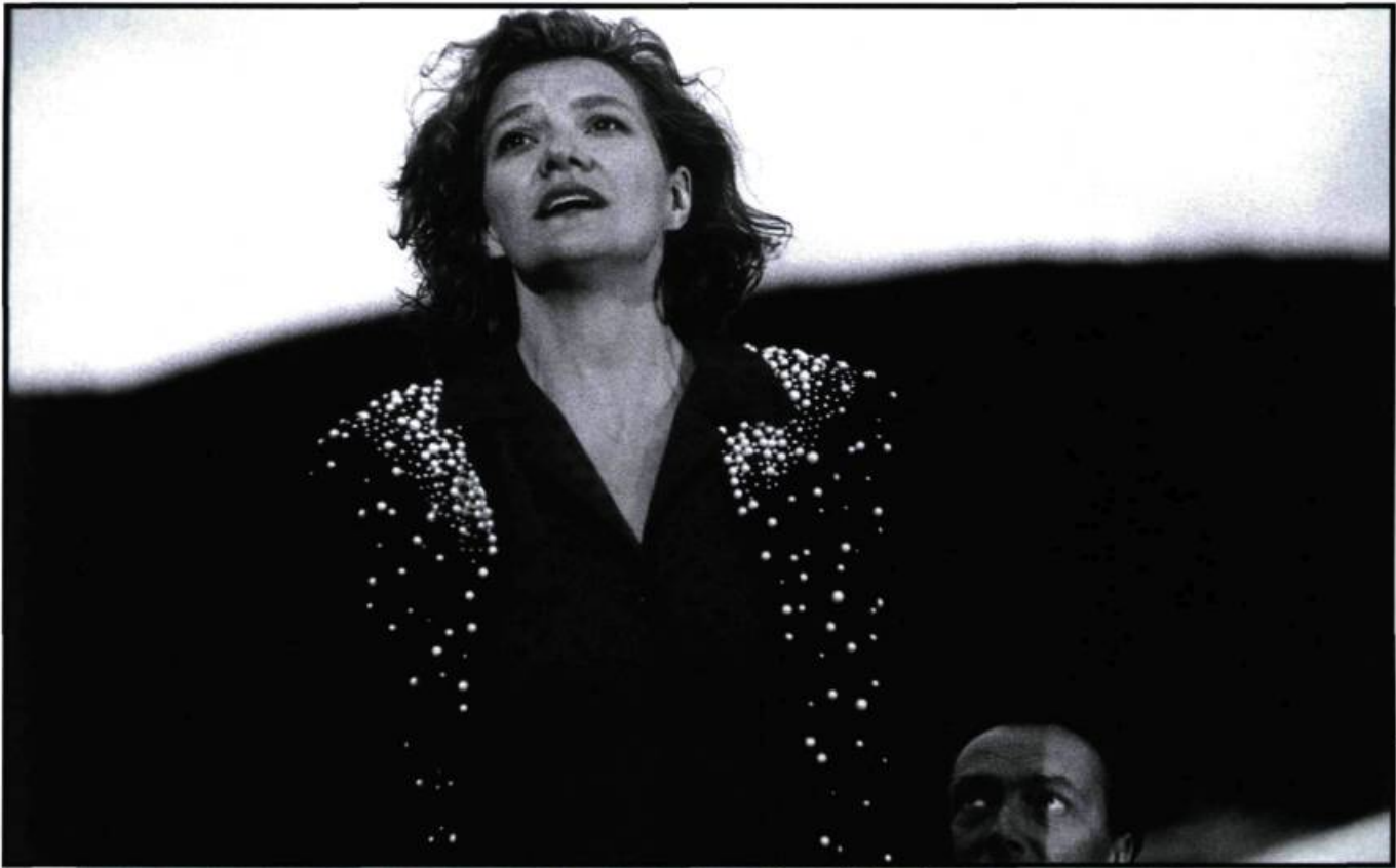
Cap Tourmente (1993) de Michel Langlois.

L'institution s'appelle l'École nationale de théâtre et c'est la formation pour le théâtre qui représente la base de l'enseignement qu'on y reçoit; ça reste le premier art, et l'épreuve suprême pour l'acteur. D'ailleurs, quand je reviens au théâtre après quelque temps passé à la télé ou au cinéma, c'est là que je mesure où j'en suis dans mon métier. Le vrai test est là. Par contre, les responsables des dif-