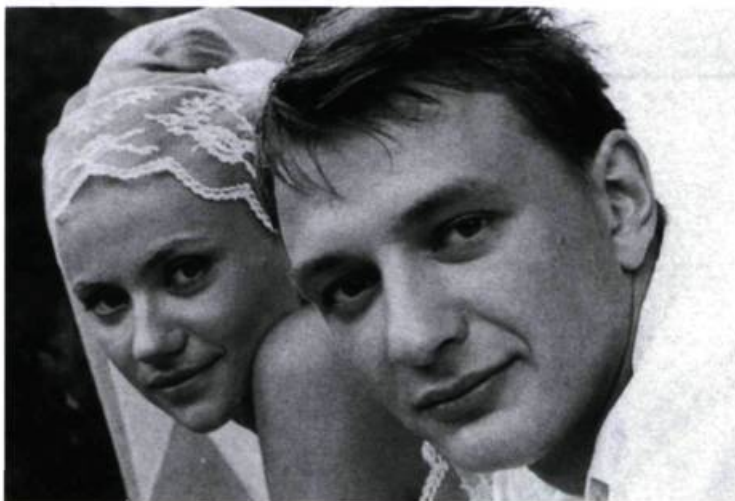
La noce de Pavel Lounguine.