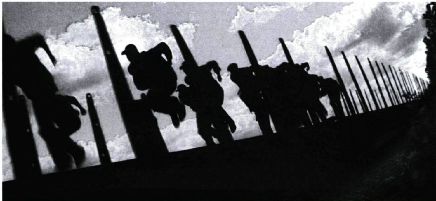
Dancer in the Dark de Lars von Trier.

Sauf quelques-uns, les vingt-cinq films de la compétition officielle avaient en commun leur durée exceptionnelle; six d'entre eux se payaient même le luxe de déborder largement les deux heures et demie de projection, la palme d'or de la durée revenant à Eureka de Aoyama Shinji (3 h 37 min). Le fait de déborder le chronométrage classique imposé le plus souvent par les structures de la distribution commerciale n'est certes pas répréhensible, on ne peut que s'en réjouir lorsqu'il répond à une nécessité et que le temps file à la vitesse de l'éclair pour le spectateur qui ressort désorienté de la projection, comme c'est le cas du film de Liv Ullmann, Infidèle (2 h 35 min). Mais on ne peut en dire autant, par exemple, de l'ouvrage d'Olivier Assayas, Les destinées senti-