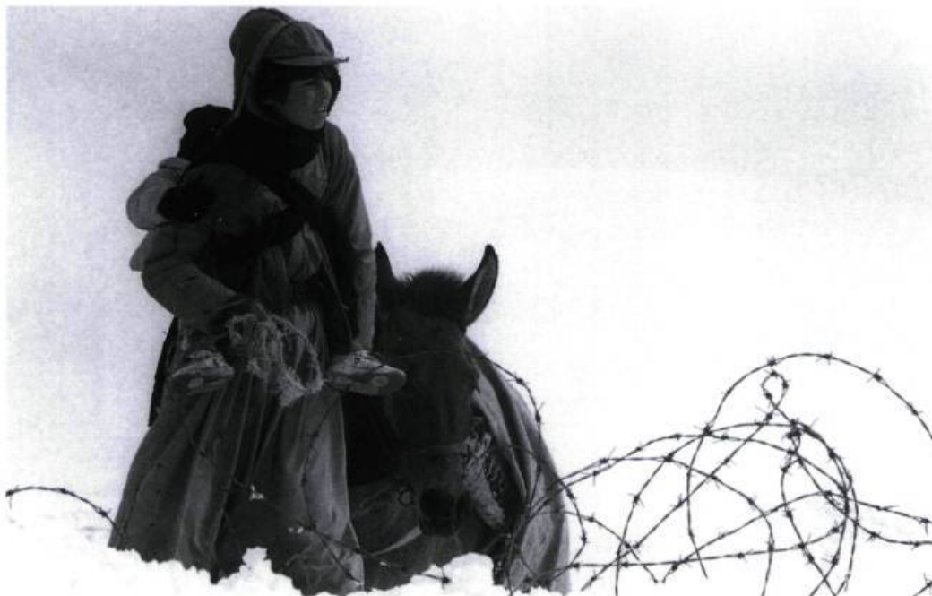
Un temps pour l'ivresse des chevaux de Bahman Ghobadi. Caméra d'or.

empoisonnées à ses rivaux et faire ressortir le côté moche d'une société, celle de Louis XIV, sous son vernis et ses costumes.