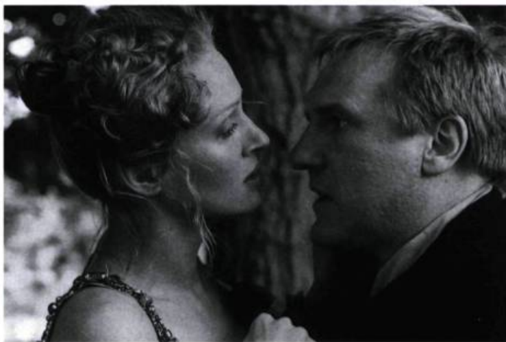
Vatel de Roland Joffé.