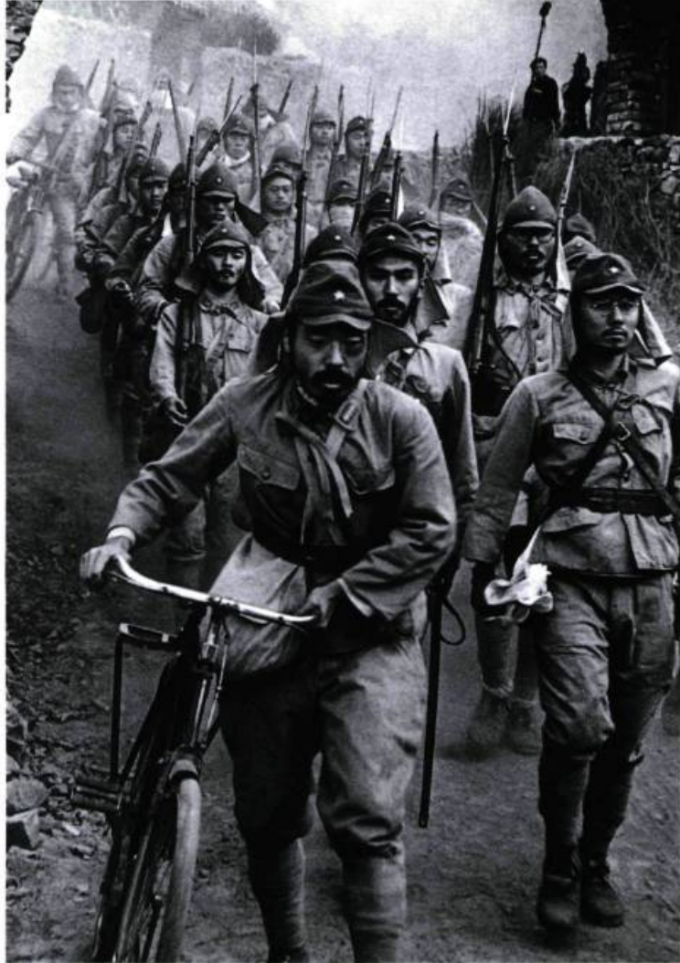
Devils on the Doorstep de Jiang Wen.