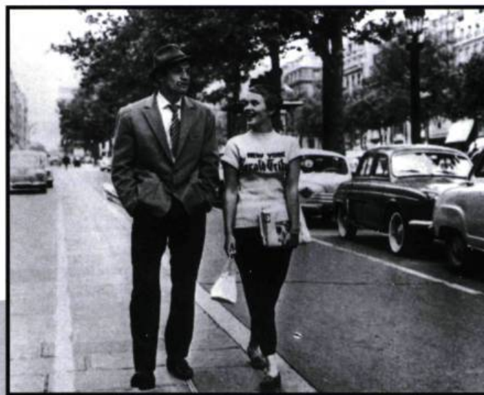
Que serait La vie heureuse de Léopold Z. sans Montréal ou À bout de souffle sans Paris?

ner le film, pas une heure de plus, il avait fallu tourner le plus possible en continuité et en plans-séquences.