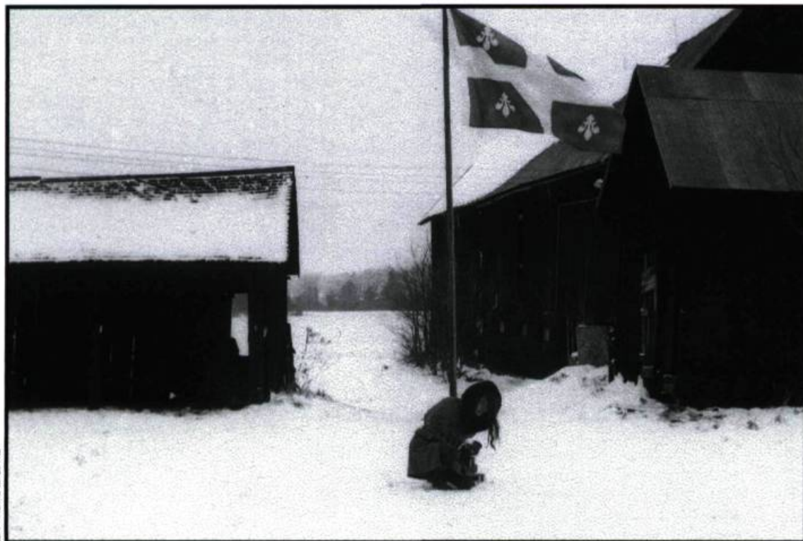
Le révolutionnaire de Jean Pierre Lefebvre.

En 1975-1977, Éducfilm, ta propre compagnie, a produit pour Radio-Canada une série documentaire intitulée «Les exclus» dont tu as par ailleurs réalisé neuf épisodes. Présentée le jeudi soir à 19 h, elle connut bientôt un tel succès qu'il fallut raccourcir les émissions de quelques minutes pour faire place à plus de publicité. L'une de ces émissions traitait des malades chroniques dont un des territoires familiers est la salle d'attente des hôpitaux, et pendant les deux premières minutes tu montrais des gens qui attendent et attendent... Ce furent ces «temps morts», bien entendu, qu'on coupa puis-que en apparence il ne s'y passait rien. Pas de quoi fouetter un chat?... Au contraire, voilà le cancer que la télévision a transmis au monde réel (pas tout à fait mais presque étant donné qu'il s'agissait d'une suite de plans reproduisant des situations similaires), on a aussi coupé deux minutes d'espace réel. Or, le temps réel et l'espace réel sont inextricablement liés. Einstein l'a clairement énoncé: «Quand je regarde l'espace, je regarde du temps». Je vais par ailleurs redire la même chose une millièrme fois: c'est l'espace-réel-hiver-froid qui, lors du tournage de mon premier long métrage en 1964, Le révolutionnaire , a imposé au film un temps, une durée, une rythmique, que je ne lui avais jamais imaginés et que j'avais encore moins rationnellement voulus. Pour que les comédiens et la caméra ne gèlent pas, en effet, et également parce nous avons cinq jours pour tour-