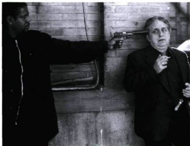
Ghost Dog (Forest Whitaker) et Louie (John Tormey).

Le scénario basique (il s'agira, comme dans tout film de gangsters, de savoir qui le premier éliminera l'autre, qui, entre un mafieux et Ghost Dog, sera abattu) emprunte une logique des sensations dans laquelle la substance du récit et sa forme ne font qu'un, appartiennent à un même mouvement qui fait décoller littéralement le film. (La musique du groupe RZA, faite de répétitions à l'infini et qui se boucle comme une bande de Moebius, n'est pas pour rien dans l'aspect rêveur, à la limite de l'hallucination, que dégage l'œuvre.) Une logique qui pose l'image comme une chose insaisissable, volatile (la présence des oiseaux est métonymique), un peu comme Ghost Dog lui-même, un être qui n'est jamais là où on l'attend, disparaissant et réapparaissant, déterritorialisant tout espace. Ghost Dog est un film des fluides, où tout glisse, coule, se délie et se dilue; un film de l'apesanteur, fidèle en cela à ses références nippones et aux préceptes bouddhistes selon lesquels «la forme est le vide et le vide est la forme» et les contraires doivent s'abolir. Il n'existe pas de barrières entre les personnages (dénudés, d'ailleurs, de toute psychologie explicative): ainsi Ghost Dog et Raymond (Isaach de