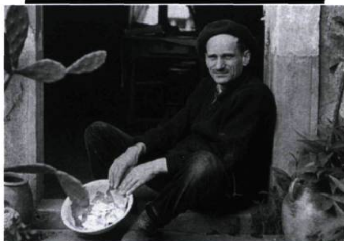
En haut: Georges Rousse, la lumière et la ruine. En bas: Gaston Chaissac, plante vivace.

l'inventivité, réelle et stimulante, des projets dont parfois ils se trouvent à témoigner. Voyez Daniel Libeskind: Welcome to the 21 st Century (pourtant produit par la BBC), dont le projet audacieux est épinglé comme «exemple d'architecture dominatrice», du fait qu'il jure singulièrement avec le reste du bâtiment du Victoria and Albert Museum à Londres auquel il s'accroche d'une façon arrogante et outrageante.