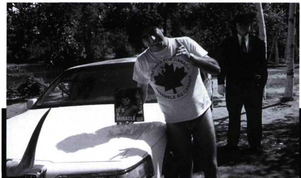
Film de bécoses et de limousines, de poupounes et de moumoutes, où le papier de toilette n'est jamais loin du «World Show», Miracle à Memphis filme le Québec à l'heure de sa «grattonisation» comme un paradis de la consommation où tout est mis au même niveau.

Tandis que dans le premier long métrage le personnage s'évertuait à ressembler aux autres, dans le second il ne peut que constater que tout le monde lui ressemble: de Jean Charest («Il est pareil comme moi; il pense exactement comme moi!») au jeune «squeegee» qui vient avec son fils lui demander un autographe. Coupé