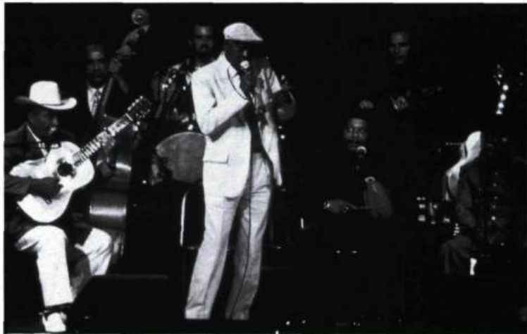
Compay Segundo, Eliades Ochoa, Ry Cooder, Ibrahim Ferrer, Omara Portuondo.) 101 min. Dist.: Alliance Vivafilm. — R.L.

De façon significative, le film s'ouvre et se ferme, non pas sur les concerts, mais sur Cuba et ses musiciens. Vers la fin, Wenders se permet tout au plus de montrer au passage, sans avoir l'air d'y toucher, quelques banderoles décrépités de Karl Marx et de la « révolution éternelle ». En lieu et place de l'échec de cette utopie, l'essai de Wenders nous dit, sans le besoin du verbe mais en utilisant plutôt la symbolique propre aux sons, qu'une musique durable vaut mieux qu'une révolution problématique. (All./É.-U./Fr./Cuba 1999. Ré.: Wim Wenders. Avec: