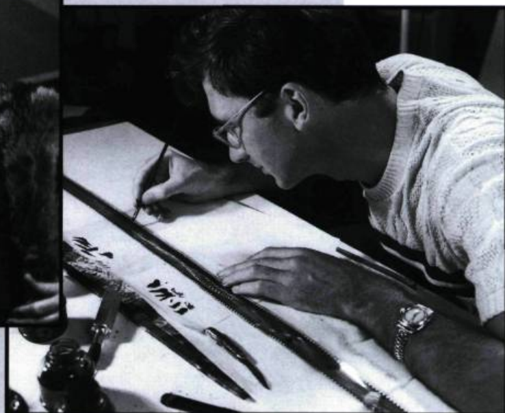
Le talent d'un Norman McLaren aurait-il pu se développer ailleurs qu'à l'ONF?

«Dans cette nouvelle perspective, l'ONF, par exemple, est une dépense qui doit se justifier, [...] une institution à abolir impérativement, de la même manière et pour les mêmes raisons qu'on demande la privatisation et la rentabilisation de la santé, de l'éducation et, du moins pour certains théoriciens, de la justice, de l'armée, etc.»