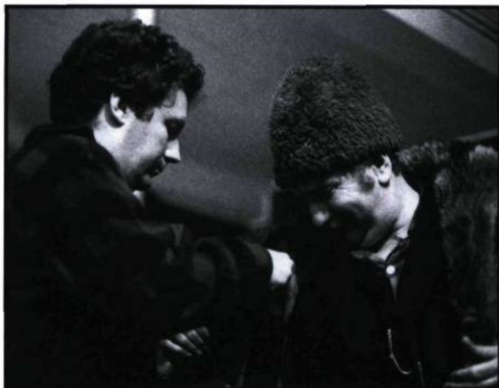
Réalisé en 1971, à la belle époque de l'ONF, Mon oncle Antoine fut désigné il y a quelques années comme le meilleur film canadien de tous les temps. Claude Jutra et Jean Duceppe sur le tournage.