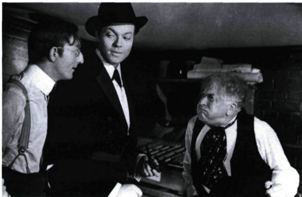
Citizen Kane (Orson Welles au centre). C'est un homme de théâtre qui a apporté au patrimoine cinématographique le film classé comme le plus grand de tous les temps.

Théâtre-cinéma, couple inséparable. Et pour cause. Les premiers cinéastes viennent du monde de la scène, du vaudeville comme des variétés. Georges Méliès était le directeur du théâtre Robert-Houdin; Ernst Lubitsch était un comédien du théâtre yiddish berlinois; Vincente Minnelli travaillait à Broadway. Et on ne compte plus les noms de cinéastes qui ont été metteurs en scène de théâtre avant d'être réalisateurs de films: S.M. Eisenstein, Max Ophuls, Luchino Visconti, Laurence Olivier, Ingmar Bergman, Rainer Werner Fassbinder, etc. C'est quand même un homme de théâtre qui a apporté au patrimoine cinématographique le film classé comme le plus grand de tous les temps: Citizen Kane d'Orson Welles. (On ne sera pas étonné que Roger Planchon et Patrice Chéreau citent tous les deux cet auteur dans les entretiens qui suivent.) À l'inverse, combien nombreux sont les cinéastes sans expérience concrète des planches qui ont affronté le théâtre pour abolir divisions et dichotomies entre les deux