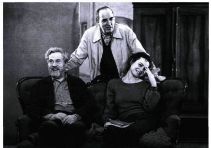
Ingmar Bergman, sur le tournage de Après la répétition , en compagnie de Erland Josephson et Lena Olin.