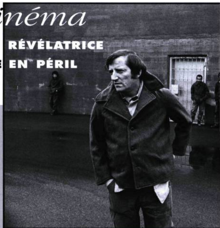
Jean Lapointe dans Les ordres de Michel Brault, un film qui donne aux événements d'octobre 70 une portée universelle.

S'ils ont d'abord provoqué une réaction compréhensible de peur et de repli sur soi au sein d'une population peu politisée, ces événements auront finalement joué un rôle de catharsis et permis au peuple québécois et à ses institutions d'accéder à plus de réalisme. En se substituant au romantisme, ce réalisme politique aura contribué à préciser un objectif commun, à refaçonner un idéal. Octobre 70 a donc joué au Québec un rôle déterminant. On y revient périodiquement, non par nostalgie, mais parce que ce moment historique constitue le sésame, la clef indispensable à la compréhension du Québec contemporain et de ses aspirations.