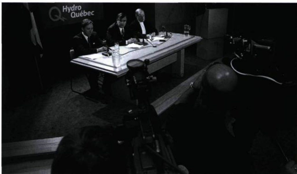
Conférence de presse quotidienne de temps de crise: le ministre de la Sécurité publique, Pierre Bélanger, le premier ministre, Lucien Bouchard et le PDG d'Hydro-Québec, André Caillé.

Les plus intéressants spectacles offerts par la télé cet hiver ont tous à voir avec la météo: les