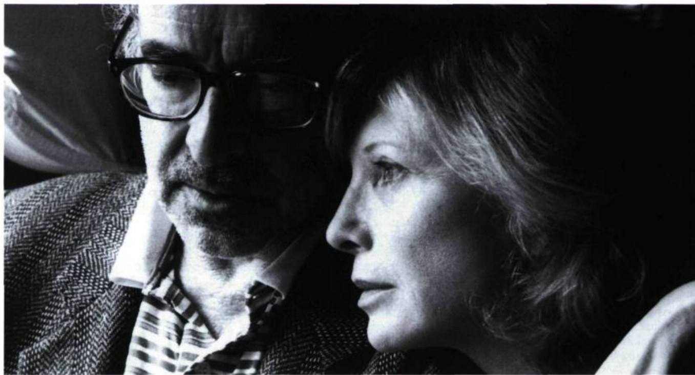
Jean-Luc Godard et Aurore Clément.

la dialectique portant sur l'individu et le nombre). Elle se rend chez Calliclès (Bernadette Lafont, autoritaire, pétillante) afin de discuter de la supériorité de l'être humain et de la justice qu'il peut rendre. Leur dialogue reprend un texte du Gorgias de Platon, dans lequel Socrate aide son élève Calliclès à accoucher de la vérité par sa fameuse méthode, la maïeutique. Leur conversation se déroule dans la maison de Calliclès et celle-ci, tout en répondant aux questions pressantes de Socrate, continue son train-train: repasser le linge, coudre, se maquiller, etc. Cette part réaliste de ce premier chapitre, donnée par les gestes et le lieu, n'occulte pas une mise en scène volontairement théâtrale. À cet aspect théâtral répondront, d'ailleurs, le vrai plateau de théâtre de la seconde partie et les «scènes» de ménage (si on peut dire) de la troisième. Anne-Marie Miéville clôt brusquement la conversation philosophique par un rideau rouge,