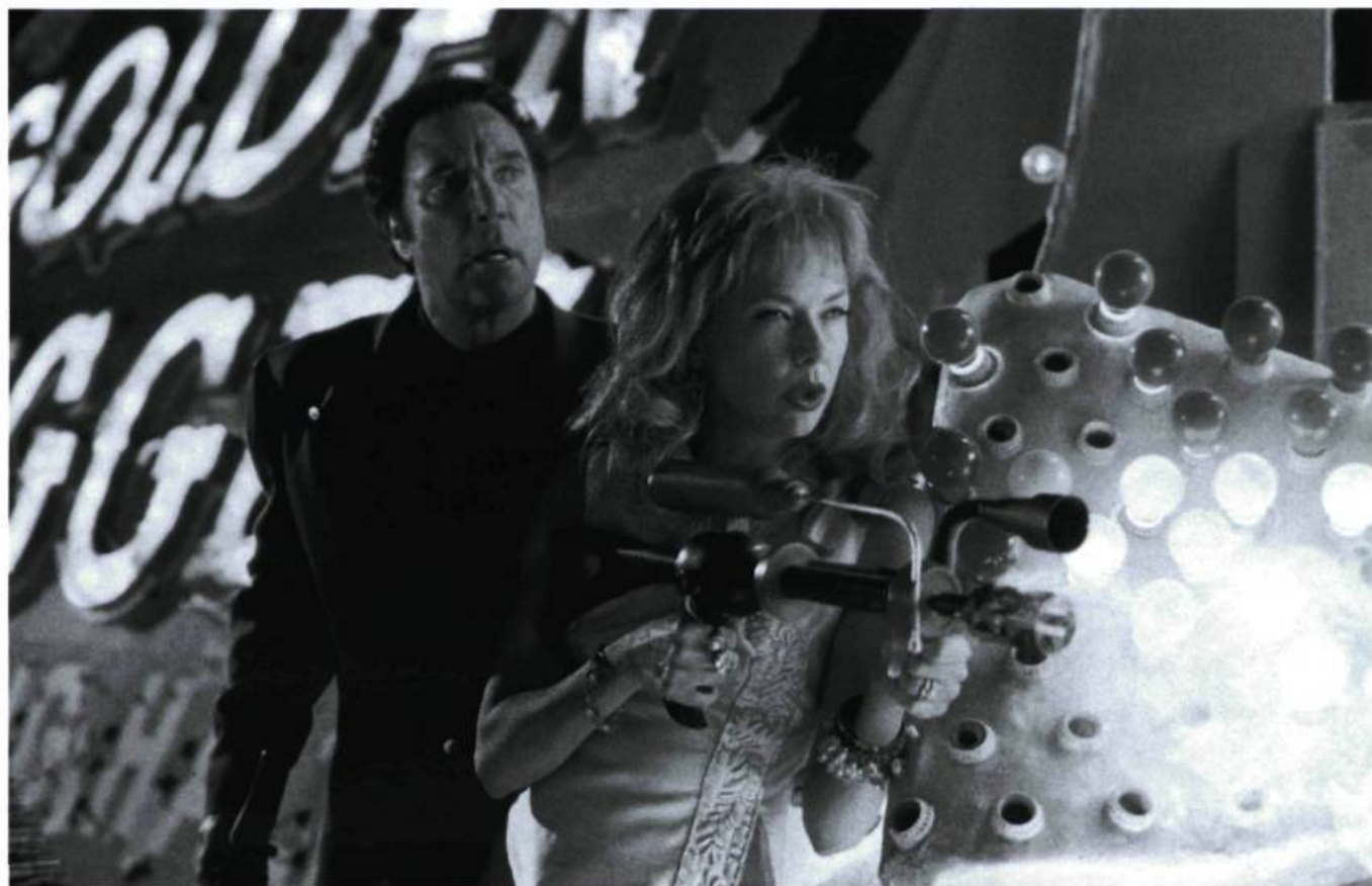
Tom Jones et Annette Bening. Mars Attacks! apparaît comme le double inversé d' Independence Day .

seulement au réalisateur de signer une œuvre dont le statut de mégaproduction ne doit pas cacher la surprenante étrangeté, mais aussi d'aller à contre-courant de ce qui fait sa réputation de visionnaire flyé — cette étiquette qu'on lui a collée trop vite —, se montrant à l'aise dans l'installation de nuances et climats fragiles, comme il l'avait fait d'ailleurs pour Ed Wood , son opus précédent. Or, bien que tous ses films racontent la rencontre de deux mondes, il reste néanmoins que Mars Attacks! peut avoir quelque chose de déconcertant: il serait facile en effet d'y voir un film «drôle mais inégal» compte tenu de l'apparente banalité des segments terrestres. Pourtant, ce réalisme «de l'insignifiance» — un pseudo-classicisme, en quelque sorte — n'est pas du tout le fruit d'une pauvreté d'imagination (comme on a pu le lire ailleurs), il a au contraire comme fonction de donner plus d'efficacité à la satire. En définitive, la drôlerie débridée des Martiens a d'autant plus d'attrait et la satire, d'autant plus d'efficacité que les mœurs terrestres paraissent légèrement ennuyeuses et un peu vides de sens.