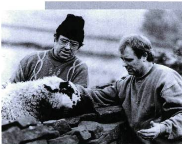
Raining Stones de Ken Loach.

facteur unique d'aliénation physique des classes pauvres. En fait, l'authentique cinéma de gauche des années 90, qu'il soit de combat ou de constat, c'est plutôt du côté des héritiers du Free Cinema anglais qu'il faut le chercher. Mike Leigh ( Naked, Secrets and Lies ), Ken Loach ( Land and Freedom, Raining Stones ) et Stephen Frears ( The Snapper ) impriment au corps social une silhouette nouvelle qui n'est pas sans rapport avec l'expérience télévisuelle de chacun (technique héritée du direct, improvisations, séquences aux accents documentaires, etc.). Plus sociologique, le regard se fait souvent aussi plus complice de la réalité qu'il étreint et de la condition qu'il décrit, comme en témoigne la scène générique assez loufoque de Raining Stones : deux hommes se livrant dans la lande anglaise à une chasse au mouton maladroite et désordonnée. — A.C.