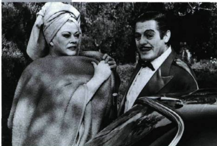
VIEILLISSEMENT. Anita Ekberg et Marcello Mastroianni dans Intervista de Fellini.