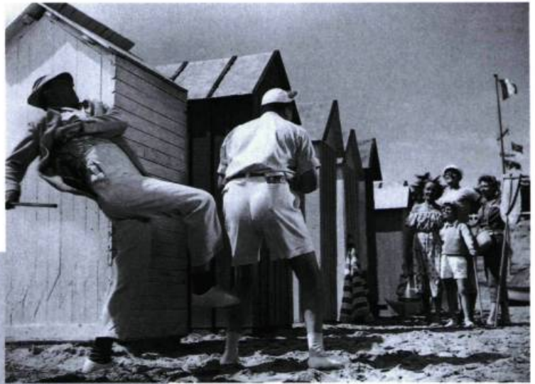
RÉALISATEUR- ACTEUR. Jacques Tati dans Les vacances de M. Hulot .

PROLÉTAIRE — Lourdemment hypothéqué par le réalisme socialiste, le corps prolétaire — visage charbonné et mains frottées de cambouis — appartient aujourd'hui au folklore, d'où l'intérêt soudain que lui portent des cinéastes opportunistes comme Berri ou Lelouch: Germinal , c'est Zola à Disneyland. À l'âge du chômage structurel, le travail cesse du reste d'être le