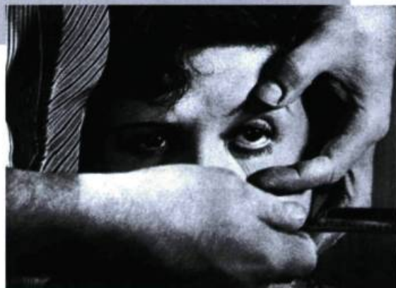
Un chien andalou de Luis Buñuel.

ŒIL — L'organe par lequel le cinéma arrive, celui sans doute par lequel il mourra. Passé au fil du rasoir par Buñuel en 1929 dans Un chien andalou , l'œil (au singulier) est couturé par Roger Corman en 1990 (voir l'affiche de son Frankenstein Unbound ). Entre ces deux dates, il aura subi toutes les chirurgies possibles et permis à un nombre incalculable de cinéastes de signifier en gros plan l'angle mort de la mise en scène, c'est-à-dire le moment précis où ce qui nous regarde ne nous voit pas. Ouvert à toutes les métaphores et prêtant aux mises en abyme les plus vertigineuses, il reste aujourd'hui encore, même à l'ère des images de synthèse, la synecdoque la plus courante pour suggérer les métamorphoses du corps tout entier ( Ladyhawke , Cat People ). Ce sas de l'âme sert à distinguer la machine de l'humain (c'est par son observation vidéo qu'on identifie les «replicants» dans Blade Runner ) quand il n'est pas le seul attribut anthropomorphique dont on l'affuble (le judas cyclopéen de Hal 9000 dans 2001 A Space Odyssey ). — A.C.