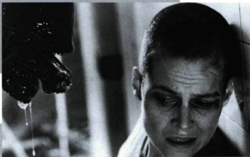
CHAUVE. Sigourney Weaver dans Alien 3 .

BURLESQUE — Venu de la commedia dell'arte , le cinéma burlesque enlève au corps ses frusques colorées (d'autant qu'il est en noir et blanc) et seyantes pour le vêtir de costumes élimés, déchirés, fripés. La défroque de Chaplin est reconnaissable à mille lieues, même en contre-jour, même en silhouette. C'est un corps fatal parce que particulier, inassimilable à aucun autre, unique (Keaton ou Chaplin ne peuvent être interchangeables avec Harold Lloyd ou Max Linder). Le corps burlesque est grotesque, c'est-à-dire qu'il n'est pas convenu: il doit provoquer un effet visuel immédiat et donc faire rire le spectateur qui l'adopte illico pour ses défauts. Le personnage burlesque est l'innocence «corporifiée»; c'est pourquoi,