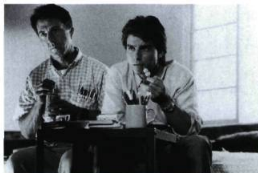
TICS. À gauche, Dustin Hoffman dans Rain Man de Barry Levinson.

VIEILLISSEMENT — 1) Personnage. Faire vieillir un personnage, laisser croire qu'il passe d'un coup de trente à soixante-dix ans, est une chose délicate, le corps pouvant difficilement mentir au cinéma (sauf dans les comédies). Au pire, il faut que les effets spéciaux soient invisibles et que l'acteur ne joue pas les vieillards de manière stéréotypée. Parfois, on a recours à la substitution de comédiens, mais cela ne fonctionne