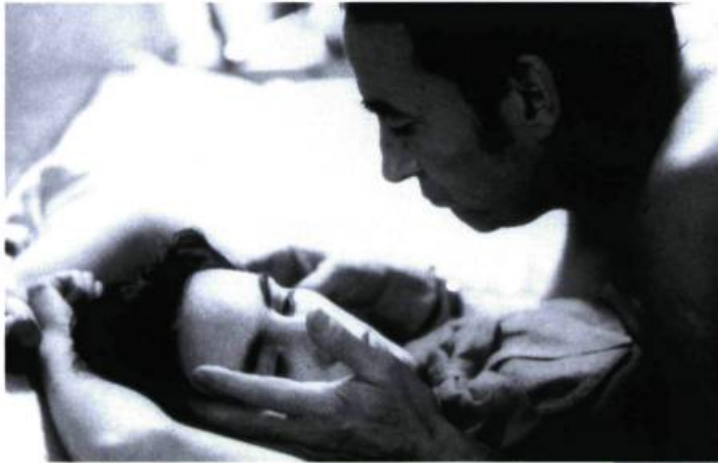
JOUISSANCE. Sale comme un ange de Catherine Breillat.

ÉROTISME — Catégorie fallacieuse qui a peu ou prou de valeur axiologique dans la connaissance du cinéma, l'érotisme délimite ce qui est acceptable dans la représentation fétichiste du corps. Le corps promu érotique est un simulacre: soft, lisse, doux, souple, sans accroc, sans trou et sans relief (aucune tumescence montrée); policé, homogénéisé, esthétisé. Normalisé, il reconduit la condamnation générale de sa génitalité. Il est sacralisé parce que déréalisé, c'est-à-dire délié du sexe, — non lié à ce sexe qu'on ne saurait voir. Il est camouflé par un appareillage sophistiqué de dentelles et de jarretelles, de chuchotis et de murmures, qui lui donne un flou artistique acceptable. Il conforte l'opinion publique, rassemble les spectateurs dans leur bonne conscience d'humanistes nobles épris d'esthétisme: l'érotisme, c'est beau! Cet érotisme voulu, forcé, m'a toujours paru ennuyant, fade, et le corps