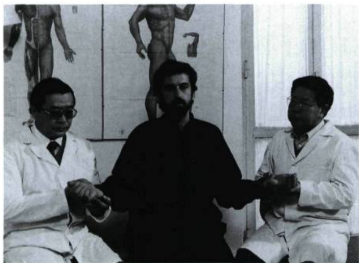
Nanni Moretti dans Journal intime .