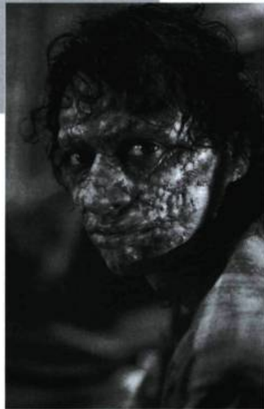
The Fly de David Cronenberg.

atteint dans sa chair à la suite d'un infarctus. Interprété par un enfant, le caillot de sang qui a causé la crise cardiaque symbolise les idéaux trahis. La vie et le cinéma se chargeront cependant de réconcilier l'artiste avec son enfance. Lieu d'exorcisme, le corps métaphorique aura alors présidé à la réunification de la personnalité fragmentée. — G.G.