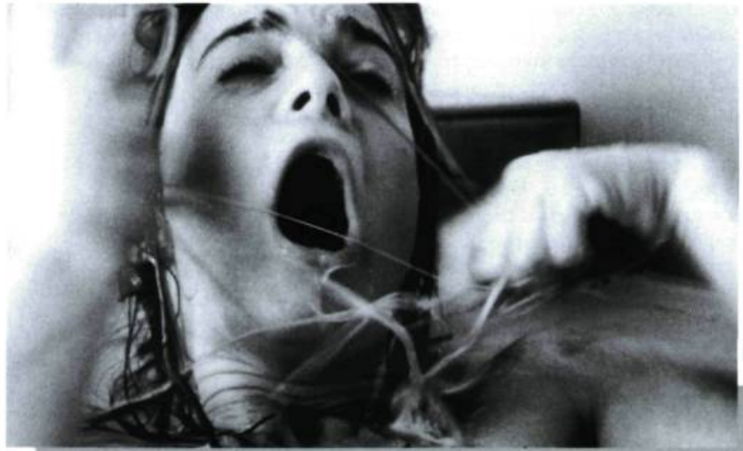
Body Snatchers d'Abel Ferrara.

Dans le cinéma d'horreur, comme dans plusieurs thrillers, l'empalement est la solution définitive au problème posé par le monstre. Du pieu qu'on plante dans le cœur du vampire aux assassins qui meurent transpercés par des tiges de bois ou de métal, le geste est le même, bien que son illustration soit constamment renouvelée. Une fois empalé, le monstre est sous contrôle. Cette atteinte suprême à son intégrité physique rassure le spectateur; c'est, avec la décapitation, l'un des deux seuls moyens infaillibles d'éliminer quelqu'un. — M.J.