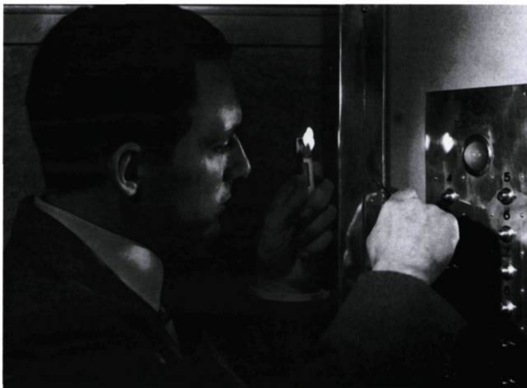
Maurice Ronet (Julien Tavernier) dans Ascenseur pour l'échafaud .

Louis Malle n'est pas un révolutionnaire, ses personnages non plus. Lui et eux ressemblent beaucoup plus aux enfants qu'il met en scène, comme Zazie ( Zazie dans le métro , 1960), qui, par leur dangereuse innocence, découvrent et mettent à jour la corruption du monde des adultes. Cette dénonciation est le pendant d'une peinture de la décadence de l'aristocratie du vingtième siècle qu'est la grande bourgeoisie, incapable de mettre en actes les belles paroles qu'en des temps moins troublés elle a prononcées. Dandy malheureux, Louis Malle va alors s'attacher dans ses documentaires ( Calcutta , 1969) mais aussi dans sa période américaine de fictions à l'exclusion, aux laissés-pour-compte, à ceux, par exemple, qui comme dans Atlantic City (1984) se réfugient dans un autre monde, issu d'un passé idéalisé. L'inadaptation, l'incompréhension mutuelle entre différents personnages qui ne vivent pas dans le même univers est sans doute la principale constante de l'œuvre du cinéaste. C'est pourquoi l'utilisation de toiles de fond historiques comme révélateur bute sur des résistances extrêmement variées, réactions individuelles plus