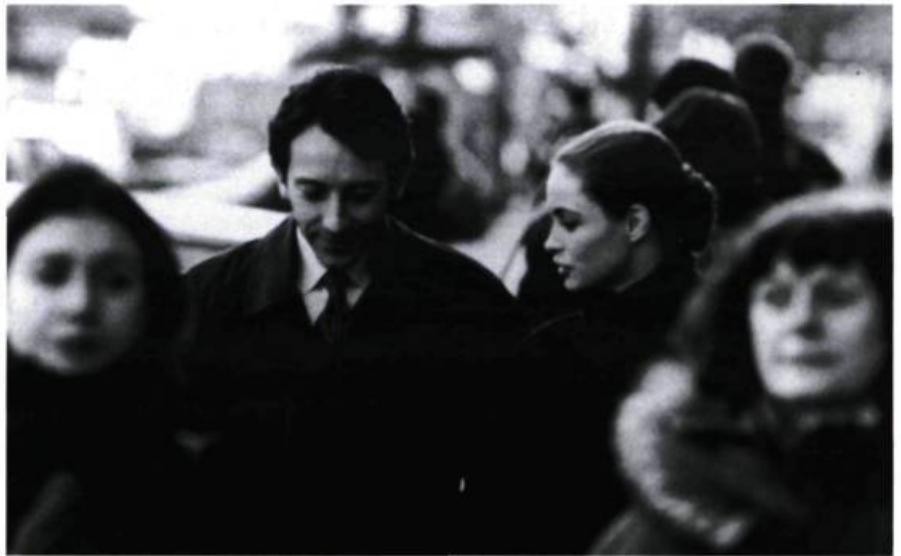
Jean-Hugues Anglade et Emmanuelle Béart.

Au cours de leurs séances de travail, qui s'apparentent d'ailleurs à l'écriture d'un scénario, Nelly suggère constamment des coupes, et donne au proluxe Arnaud des conseils d'économie narrative. Il y a de même chez Sautet une forme extrême de pudeur, un refus du cheminement direct qui le conduit à laisser en suspens des ébauches de scènes, comme le négatif d'une histoire qui ne sera pas. Jamais sa mise en scène n'avait été plus loin dans le laconisme et l'épuration, dans l'art musical de la modulation, où les variations, les cadences et les scansionnements disent la couleur des sentiments. La netteté du découpage, la précision des recadrages, la sûreté du tempo forcent l'estime. Mais cette perfection feutrée ne fait qu'accuser par contraste la fabrication du film, le peaufinage exagéré des