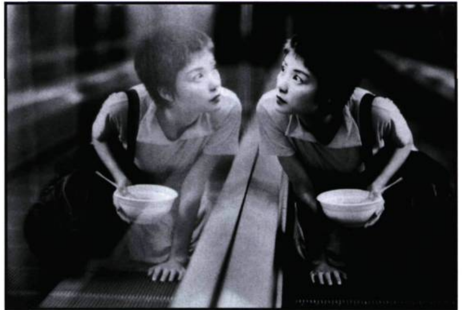
Chungking Express de Wong Kar-Wai (24 images n° 80).

par ordre alphabétique À la vie, à la mort Guédiguian Chungking Express Wong Kar-Wai Délits flagrants Depardon Deux frères, ma sœur Villaverde La cérémonie Chabrol Le couvent Oliveira Le fils du requin Merlet Little Odessa Gray Safe Haynes Sonatine Kitano