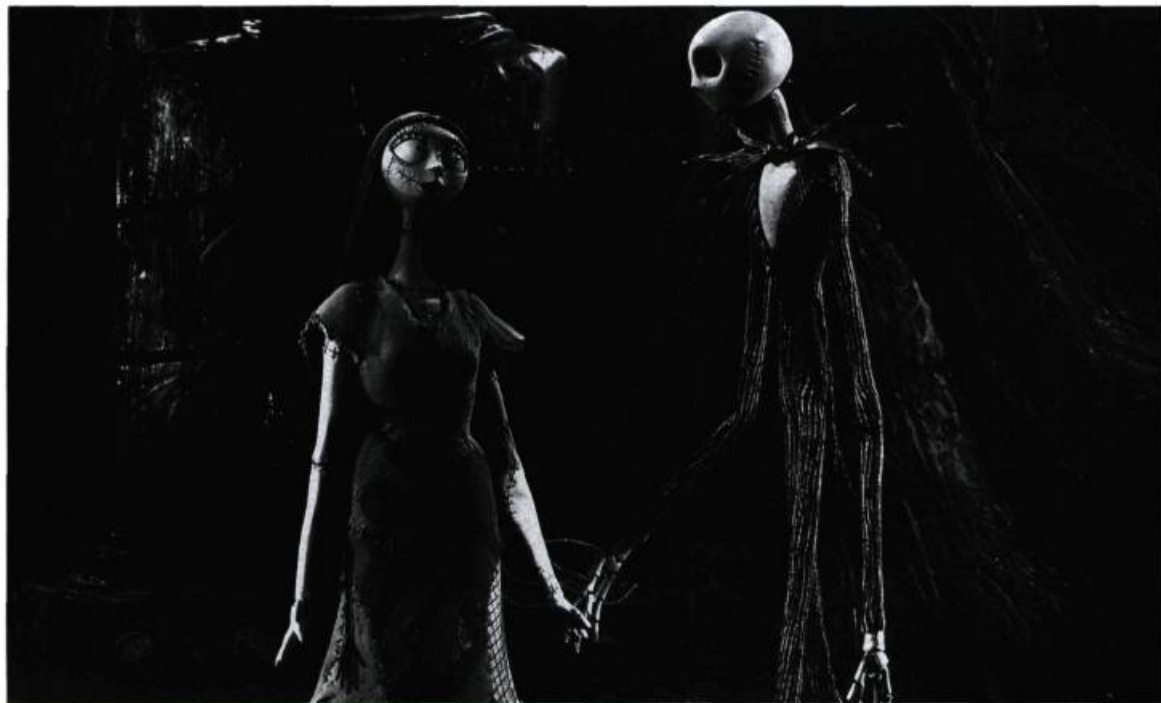
Sally et Jack.

Nightmare... , un seul personnage est ainsi animé, c'est Sally. L'incarnation de la voix de la conscience de Jack. Pour le reste, Selick fait éclater cette approche du mouvement en se livrant avec brio à une folle esthétisation des formes. Chez Jack, grand idéaliste, les gestes sont simples, théâtraux, et en même temps aériens, se jouant de la loi de la gravité. Chez le maire, notable un peu ridicule en proie à mille anxiétés, ils sont saccadés, répétitifs et très rapides, comme ceux d'un automate déglingué. Chacune des innombrables créatures du film possède ainsi son propre mouvement selon une logique imparable.