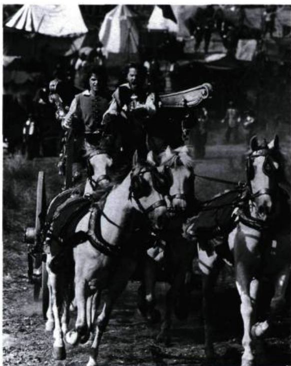
Chris O'Donnell et Kiefer Sutherland.

Disons-le d'emblée, The Three Musketeers de Stephen Herek n'a que bien peu à voir avec le roman d'Alexandre