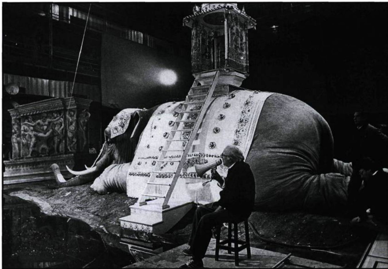
Fellini sur le tournage d' Intervista (1987).

Des clowns? Avez-vous vu au petit écran ceux et celles qui assistaient au service funéraire de Fellini?