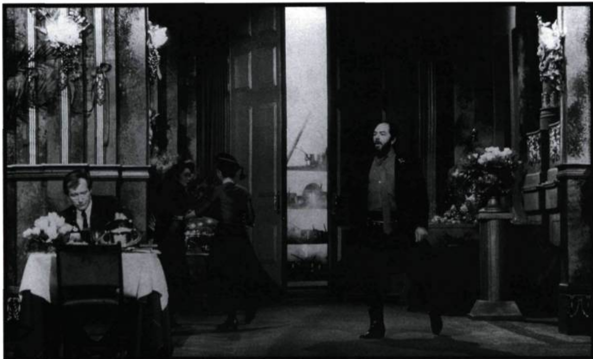
Dans The Cook, The Thief, His Wife and Her Lover , la musique a été utilisée pour donner le ton aux comédiens et techniciens.