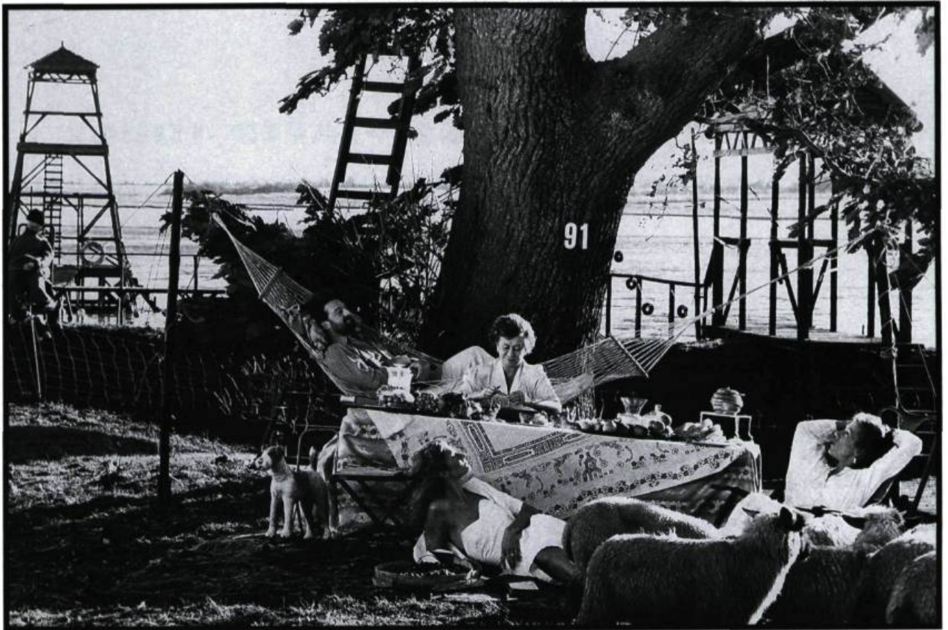
Drowning by Numbers . «... un désir de faire tenir l'espace et surtout le temps entiers, la géographie et l'histoire entières, en une seule image, en un seul lieu.»