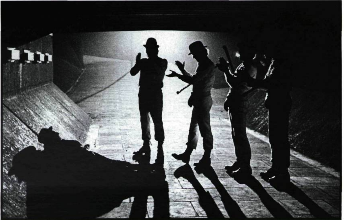
A Clockwork Orange de Stanley Kubrick, le premier film qu'Éric Kahane ait doublé. Kubrick cherchait un littéraire pour traduire son film.

Vous avez l'air d'avoir gardé le feu sacré pour cette profession. Chaque film est toujours un défi pour vous?