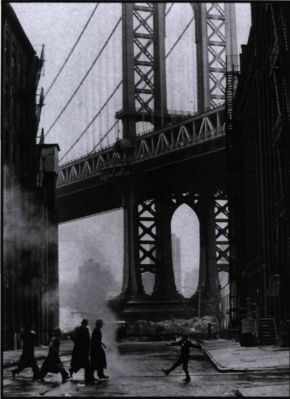
Il était une fois en Amérique de Sergio Leone.

«Avec Leone, on s'engueulait en espagnol pour être sûr de se comprendre»