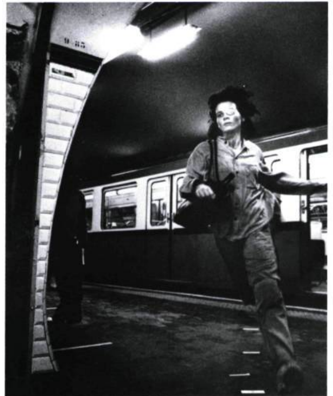
Michèle-Juliette dans Les amants du Pont-Neuf

Assurément, oui. Ce n'est pas le cas uniquement en France, mais l'argent est un tabou complètement absurde. C'est très marrant, les gens ont l'impression qu'on prend l'argent dans leurs poches. Il faut voir aussi que le cinéma est un monde très collabo,