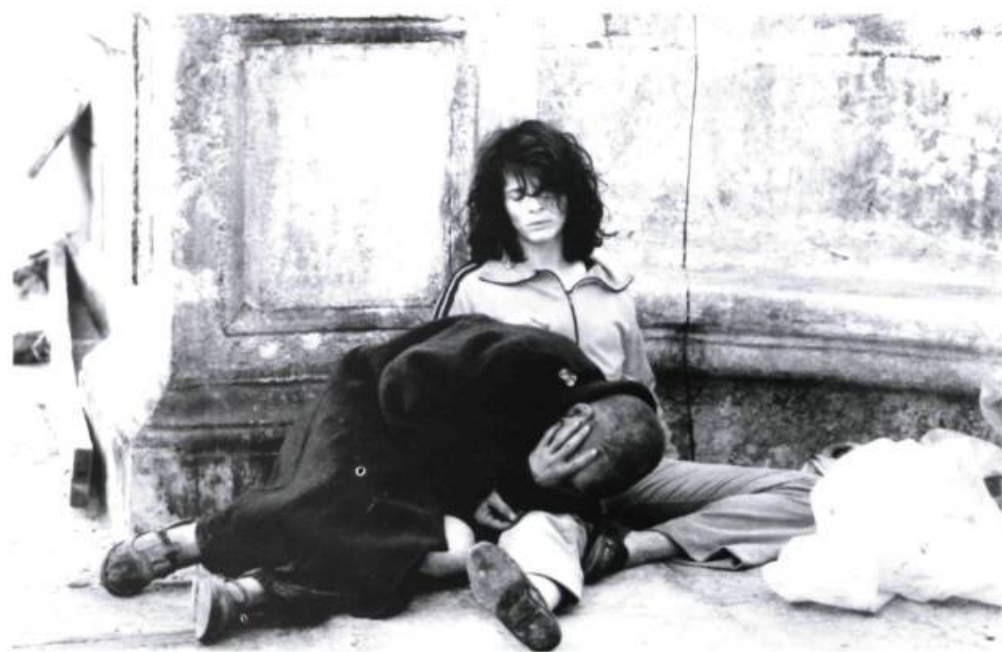
Alex (Denis Lavant) et Michèle-Juliette, Les amants du Pont-Neuf