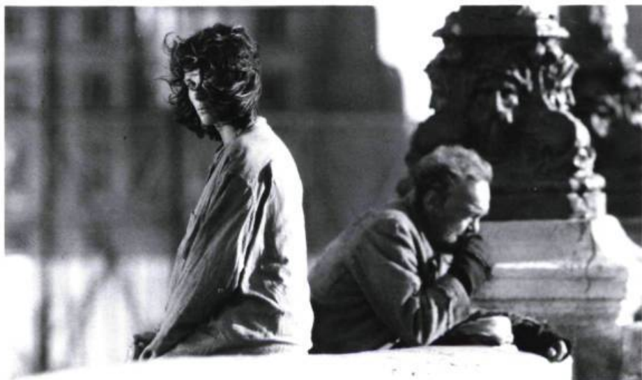
Michèle (Juliette Binoche) et Hans (Klaus Grüber), Les amants du Pont-Neuf