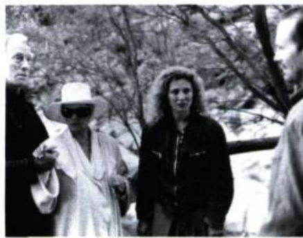
Max Von Sydow, Jeanne Moreau, Solveig Dommartin et William Hurt

s'y acoquine avec un détective allemand (Rudiger Vogler), Lisbonne, Moscou, Pékin, Tokyo, San Francisco seront les étapes de cette course-poursuite qui finit dans un coin perdu de l'Australie. À chaque étape, elle se trouve à court d'argent et envoie un SOS (à son mari le plus souvent) qui pioche dans le magot pour la secourir.