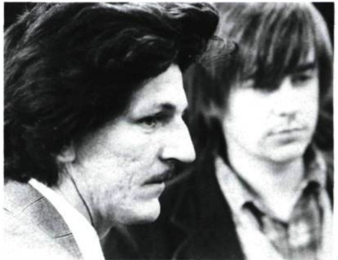
Marcotte et Forcier sur le tournage de L'eau chaude, l'eau froide (1975).