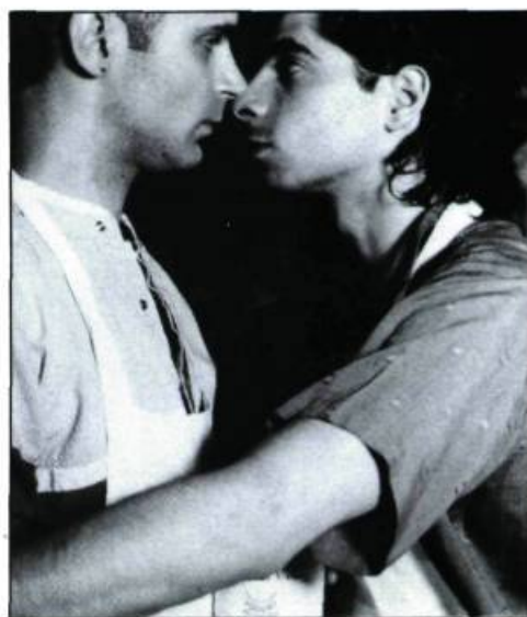
Fun Down There de Roger Stigliano

est peut-être un art! S'il n'est jamais interdit à un cinéaste de détourner une commande, on peut trouver cavalière cette façon de se servir de son sujet comme d'un prétexte indifférent à tirer la couverture à soi.