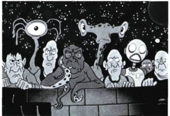
Heavy Metal de Gérald Potterton (1981) est le troisième long métrage d'animation produit au Québec.

musiciens d'ici ont une large part de création. The Smoogies a bénéficié de l'appui de Téléfilm Canada.