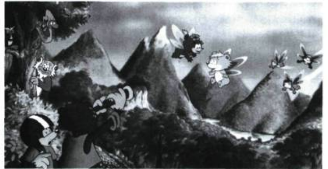
« La bande à Ovide , coproduction Québec-Belgique qui concurrence les produits japonais»

Les oursons volants est présentement en cours de réalisation chez Ciné-Groupe.