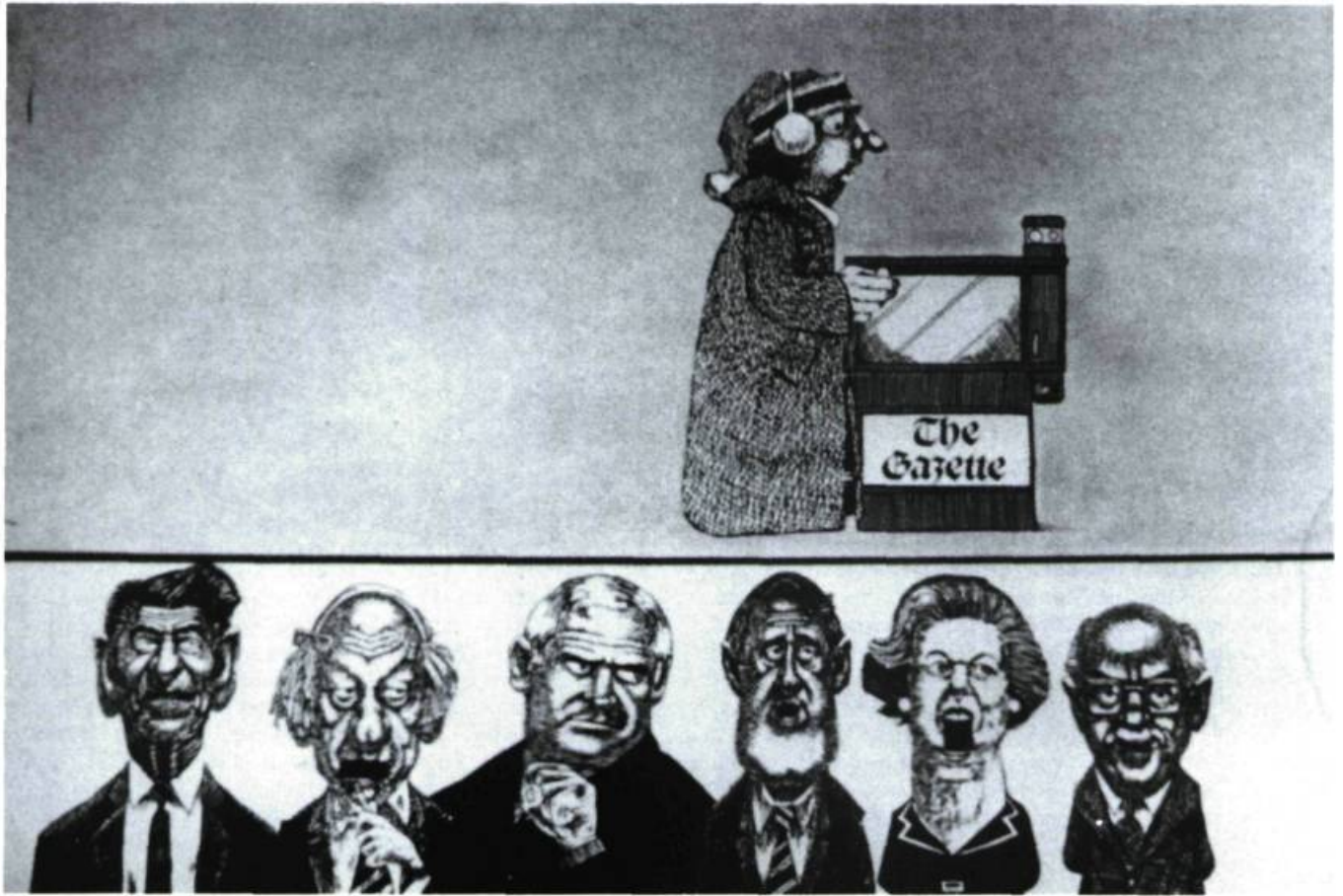
«Le film publicitaire animé est la principale activité de Michael Mills Productions, par exemple, les publicités pour The Gazette »