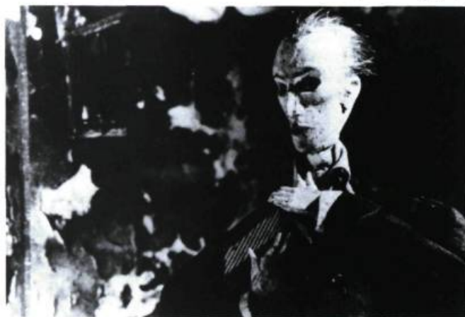
Street of Crocodiles des frères Quay. (Texte sur les frères Quay en page 34).