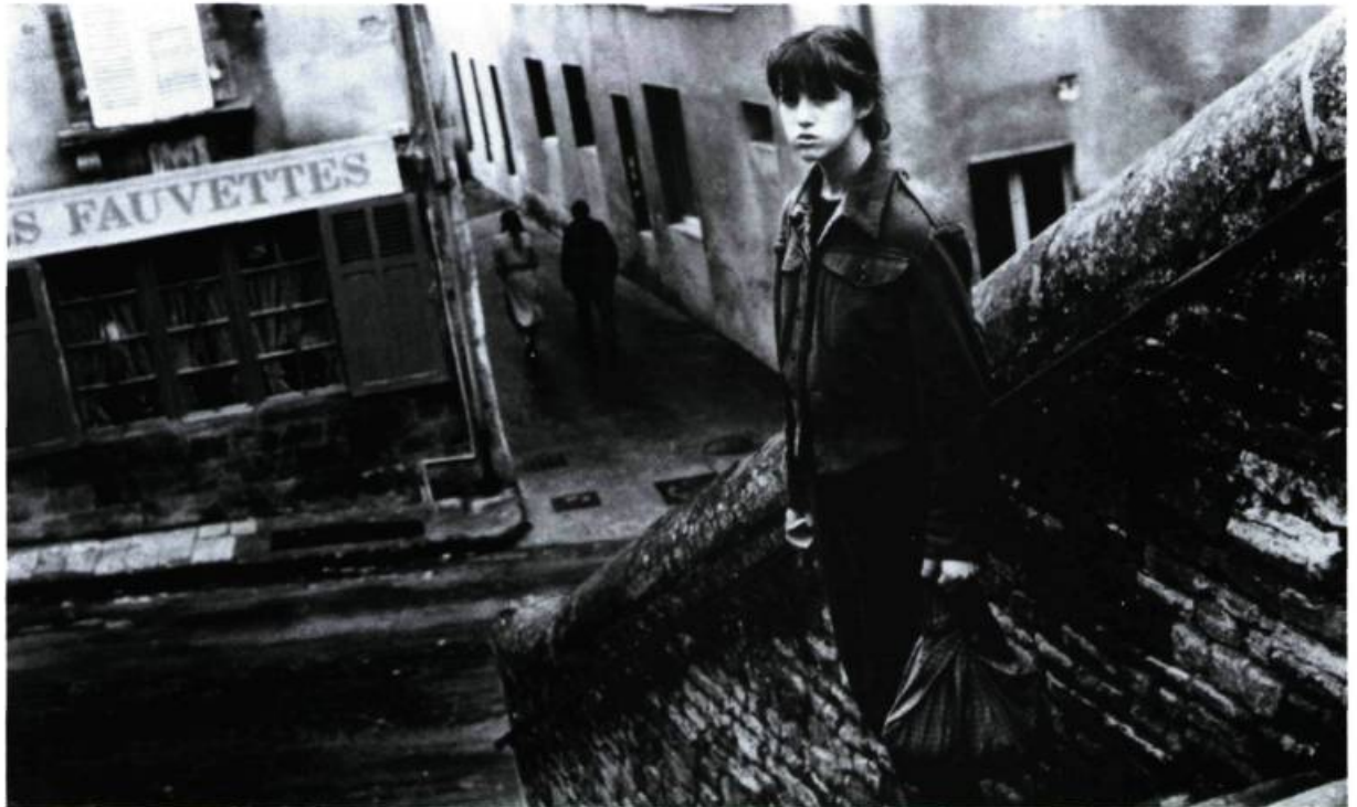
«Ce qu'il y a d'émouvant avec les adolescents, c'est que tout ce qu'ils font, ils le font pour la première fois.» (François Truffaut)

pour s'y baigner. C'est pratiquement le même plan, le même angle qu'avec Jean-Pierre L aud. Par contre, je n'ai pas tourn  la fin pr vue par Truffaut. Il y a ce texte qui apparait sur le dernier plan: «Quelques mois plus tard, elle alla voir le m decin. Elle a vu son b b  dans son ventre qui bougeait. Le m decin lui dit: Ce sera un petit agit ». Dans le sc nario de Fran ois, cette sc ne devait  tre tourn e, avec un acteur qui faisait le m decin et tout. Je trouvais cette fin un peu  troite. Finir le film entre quatre murs dans une chambre d'h pital,  a aurait manqu  un peu d'air.