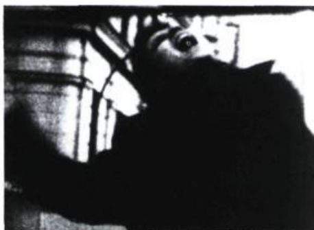
The Red Shoes . «Un film de plasticienne.»

Tourné en noir et blanc (la seule couleur du film est le rouge vif qui tranche le texte d'un générique sobre, mais très esthétique), le film multiplie les effets optiques. L'image, texturée par une forte granulation, nous fait entrer dans un monde dont la représentation se trouve sans cesse dévoyée. Une sorte d'instabilité visuelle hante le film et ramène le spectateur à la réalité de l'image. Cela prend forme de diverses manières. Tantôt le défilement lent et saccadé des images, souvent combiné aux soubresauts des mouvements de caméra, produit des ruptures et des arrêts qui brisent la régularité des mouvements et donnent au film un caractère agité et nerveux. Tantôt, notamment dans la scène où l'orpheline circule dans le métro et dans celle, presque vertovienne, de la boulangerie, la composition de l'image, délimitée par des cadrages étudiés, laisse le spectateur dans le doute de ce qu'il voit jusqu'à ce que les recadrages rendent les lieux tangibles. Le film, en fait, est porté par un mouvement qui hésite entre la représentation d'un univers et sa dissolution dans l'image. Un beau passage symbolise cette tension : la caméra, balayant une série d'écrans vidéo où apparaît l'image spectrale du personnage filmé en négatif, finit par montrer une image qui