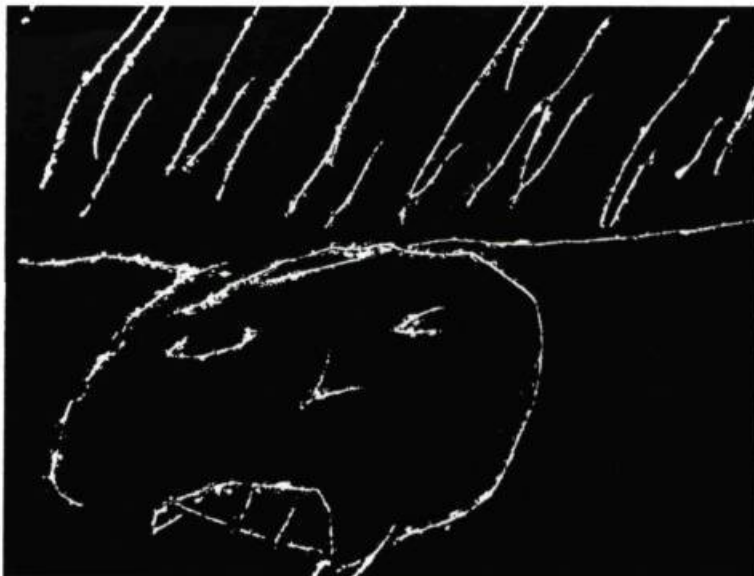
«Composer avec des images de plusieurs origines»

Aussi, de la nécessité pour Hébert de composer avec des images de plusieurs origines est né un extraordinaire effet de cinéma. D'abord vidéo, réduite à la petitesse d'un cadre serré de téléviseur, l'image se libère lentement pour adopter le format carré du 16mm. Pendant plusieurs minutes, elle flotte dans un large et énigmatique cadre blanc. Puis, soudain, comme une révélation, elle se déploie et prend toute la grandeur de l'écran. Cet espace nouveau, Hébert l'utilise comme s'il s'agissait d'un cadre (c'est-à-dire d'un plus, d'un ajout à l'oeuvre), et il s'en sert littéralement pour montrer ce qui constitue le cadre de l'action: l'escalier et la femme lors d'une première séquence, la pluie qui isole un personnage lors d'une seconde. Par cet effet, Hébert donne à voir l'écran de cinéma dans toute sa grandeur et dans toute sa magie. L'émerveillement qu'il arrive alors à susciter est comparable à celui des premiers spectateurs devant les films de Méliès. Sensation rarissime. ●