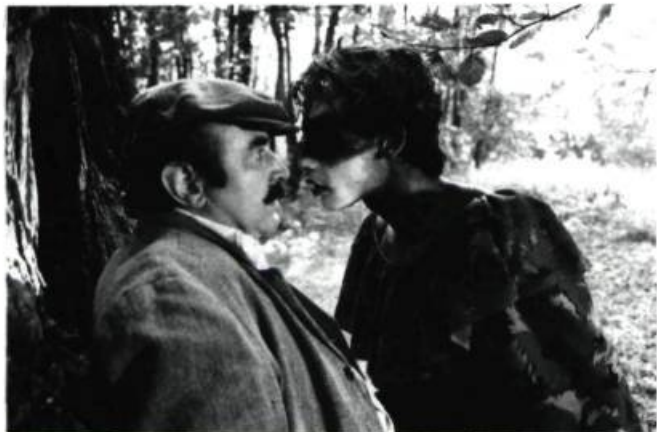
Bob Hoskins et Dexter Fletcher dans The Raggedy Rawney