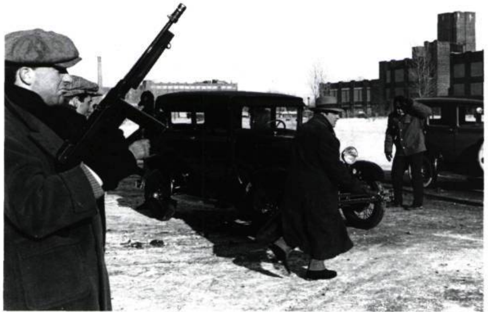
Henry Ford: The Man and the Machine , Montréal en ville américaine. Ici les abords du Canal Lachine.