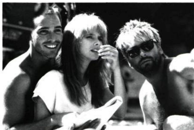
Jean-Marc Barr, Rosanna Arquette et le réalisateur Luc Besson

Deux jeunes fermiers acculés à la faillite préfèrent brûler la propriété familiale plutôt que de la céder aux requins de la finance. Commence alors pour les deux frères une dramatique odyssée aux conséquences multiples. Remise en cause du Rêve américain et des valeurs traditionnelles, désintégration de la famille (voir Les raisins de la colère ), chasse à l'homme sur fond d'Amérique rurale: Miles from Home s'inscrit dans la lignée d'un certain cinéma de genre américain déjà brillamment illustré par les Mallick, Altman, Ray et autres. Pour ce premier long métrage réalisé en marge des studios, Gary Sinise, jeune metteur en scène venu du théâtre ( Steppenwolf Theatre Company de Chicago fondée avec John Malkovich), sait faire preuve d'une bonne maîtrise intuitive du visuel. Il ne parvient pas cependant à imposer à son récit le souffle de la révolte et du désespoir. D'où la tentation, pour meubler les vides, d'enterrer son propos sous une bande-son inutilement envahissante. Peu crédible en fermier de l'Iowa, Richard Gere détonne dans son personnage de desperado marginalisé à la Bonnie and Clyde .