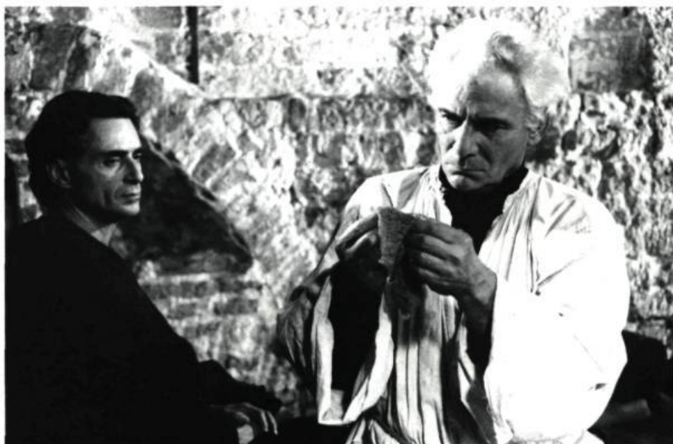
Sami Frey et Gian-Maria Volonte