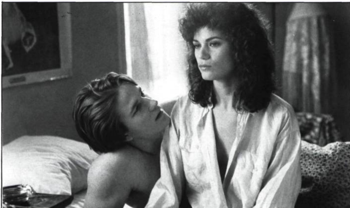
Matthew Modire et Linda Fiorentino dans Vision Quest de Harold Becker