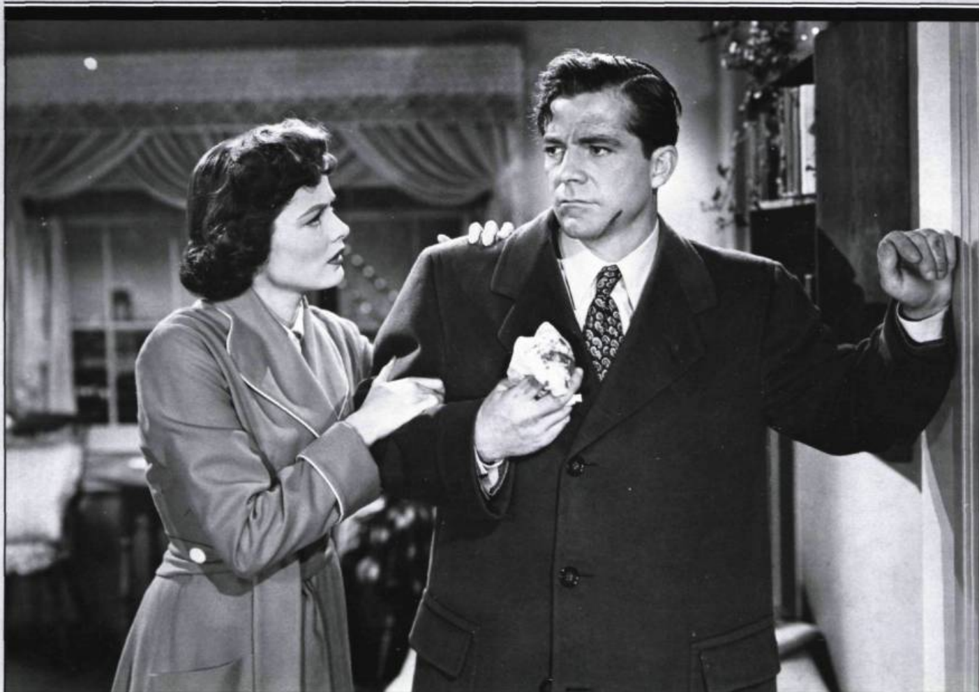
Gene Tierney et Dane Andrews and Where the Sidewalk Ends (Marc Dixon, détective), d'Otto Preminger