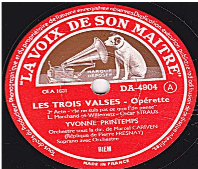
Figure 4. Image du disque 78 tours Les Trois Valses , Gramophone, 1937.