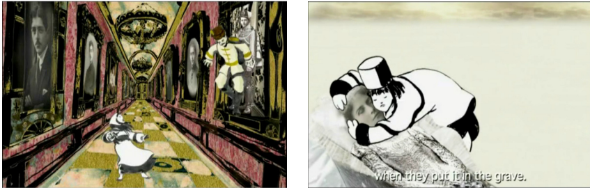
Fig. 4 et 5. Photogramme du film Irinka et Sandrinka , Sandrine Stoianov, 2007.

931 La troisième dimension sollicitée par Stoianov est de l'ordre de l'imaginaire. Dans la partie intitulée « Fairy Tales », la réalisatrice confronte ses propres projections mentales au récit que lui fait sa grand-tante. Le dessin prend alors à nouveau une place dominante, allant jusqu'à structurer à lui seul un espace fantasmé. L'archive est de nouveau assujettie au dessin, comme c'était le cas au temps présent, mais avec cette fois un éloignement délibéré d'une représentation « académique » du réel et la constitution d'un espace aux perspectives faussées ou exagérées. C'est dans cet univers imaginaire que les archives les plus inaccessibles (celles figurant un ancêtre lointain par exemple) s'émancipent de leur gangue photographique pour prendre corps sous une forme animée. Ainsi, dans un couloir improbable où sont suspendus des portraits, une figure photographique se transforme en personnage dessiné qui interagit avec la protagoniste, dessinée elle aussi (voir la figure 4). Cette transformation saisissante illustre le besoin qu'a l'auteure de passer d'un geste graphique à l'autre pour permettre une transaction à l'intérieur de son dispositif. Il en va de même lorsque Stoianov fait entrer en interaction la représentation dessinée de sa grand-tante enfant avec le cadavre de la mère de celle-ci (voir la figure 5).