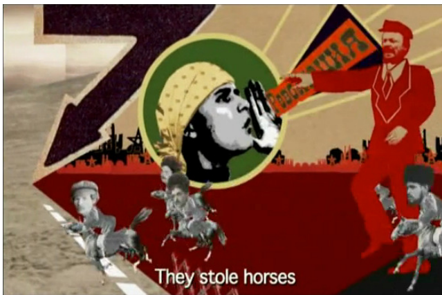
Fig. 3. Photogramme du film Irinka et Sandrinka , Sandrine Stoïanov, 2007.

929 De nombreux plans de Irinka et Sandrinka sont composés avec After Effects 34 . Sur ces images, un bâtiment, un lampadaire, une partie de chaussée sont autant d'éléments prélevés dans des archives par le truchement de ce geste de détournage, des éléments qui sont ensuite intégrés au sein d'espaces composites semblables à des collages en mouvement.