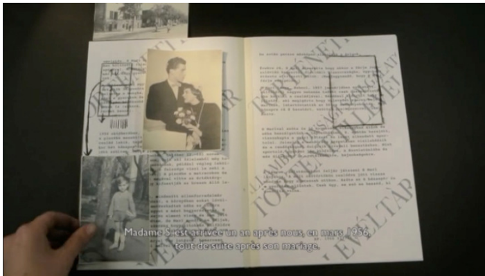
Fig. 6. Photogramme du film Le dossier de Mari S. , Olivia Molnàr, 2015.