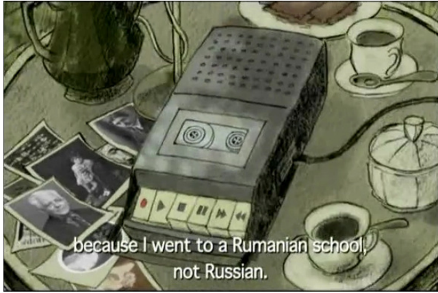
Fig. 1. Photogramme du film Irinka et Sandrinka , Sandrine Stoianov, 2007.

924 Afin de mieux percevoir la portée du geste graphique et de comprendre ses modalités performatives au sein d'une démarche mémorielle, il semble nécessaire de prendre en compte les trois dynamiques à l'œuvre dans le film : présent, passé et imaginaire.