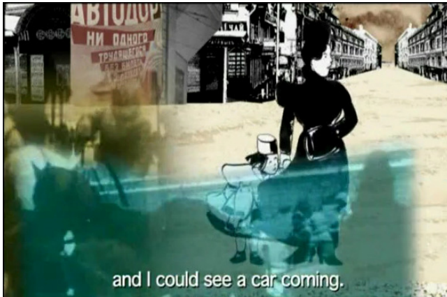
Fig. 2. Photogramme du film Irinka et Sandrinka , Sandrine Stoïanov, 2007.

926 Ce type d'intervention graphique est récurrent lorsque Stoïanov évoque le temps présent. Dans cette dimension temporelle, on assiste surtout à une première activation des images d'archives qui sont encore relativement peu déformées par le geste graphique.