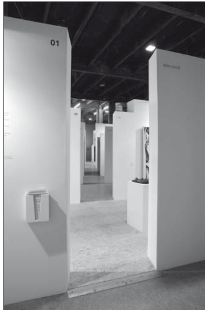
Fig. 3 : 90°, vue de la diagonale traversant l'espace d'exposition.