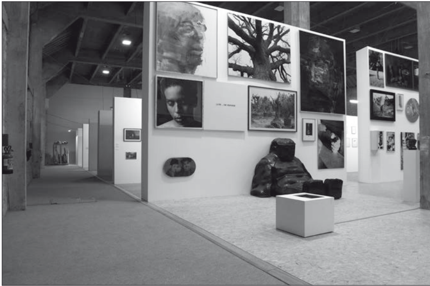
Fig. 4: 90', vue du côté nord et détail de La Grande Galerie .

plaçait le visiteur au centre même du projet architectural à travers trois types de cheminement différents : le premier destiné aux touristes, le deuxième aux esthètes et le troisième aux spécialistes. D'une certaine manière, le projet 90' est assez proche de ces « balades architecturales » individualisées que prônait Le Corbusier. Quant à la déambulation du visiteur, il n'y avait pas à proprement parler de signalétique directionnelle au sein de 90', car le dispositif était directif en soi. Mise à part une flèche indiquant à l'entrée le sens de la visite et les numéros affichés au départ de chaque galerie, les visiteurs, une fois embarqués dans le dispositif, suivaient spontanément la diagonale qui les menait d'une galerie à l'autre. Rarement, ils revenaient en arrière, bien qu'ils fussent parfaitement libres de le faire.