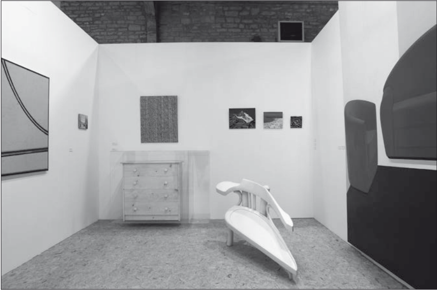
Fig. 6 : Period Room .

nos sociétés de consommation. Cela va du plateau télévisuel ou de cinéma en passant par les showrooms , les resorts tels Celebration en Floride ou La vallée des marques à Marne-la-Vallée jusqu'au Mont-Saint-Michel 9 . Il y a peu de différences, je pense, entre la visite des plateaux de tournage et le fait de se rendre chez Ikea : on y va pour voir des reconstitutions et les « consommer ». C'est une situation fascinante. Elle révèle des enjeux esthétiques concernant le rapport entre l'image, le lieu et la fiction auxquels il faut réfléchir.