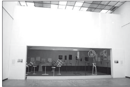
Fig. 2: Reconstruction de l'exposition de l'Obmokhou de 1921 dans les salles de la collection permanente de la Galerie nationale Tretiakov, Moscou. Auteur: Viatcheslav Koléitchouk, 2006. Exécution SARL «Vkhoutemas XXI e siècle».

exposition avait permis aux constructivistes dits « de laboratoire » de présenter publiquement les résultats des débats menés pendant les quatre mois précédents entre artistes, architectes et historiens de l'art au sein de l'Institut de culture artistique de Moscou ( Inkhokh ) sur la définition du concept de « construction » comme futur fondement de l'art 9 (fig. 3).