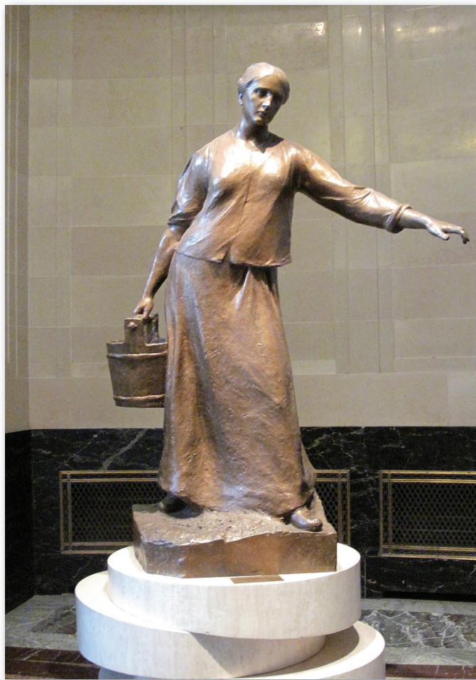
La travailleuse canadienne, Alfred Laliberté, bronze v. 1928. Collection Ville de Montréal